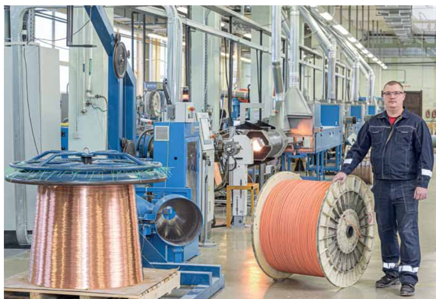
Рис. 1. В цехе по наложению огнестойкой изоляции завода «Спецкабель»

ности» внесли важные поправки. Это было связано с тем, что обычная прокладка огнестойких кабелей не всегда позволяла системам противопожарной защиты работать необходимое время в условиях пожара. Часто при пожаре обрушались подвесные потолки и перегородки, кабели оказывались не закреплены, их изоляция ломалась от нагрева и механических повреждений, и система выходила из строя. Стало понятно: огнестойкие кабели нужно надежно закреплять.